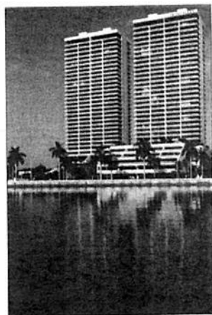
Trump in New York