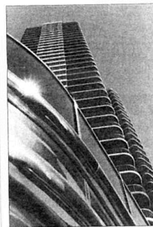
Trump in Palm Beach, Florida