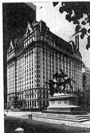
Het Palm Beach Hotel in New York